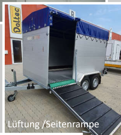
Lüftung / Seitenrampe