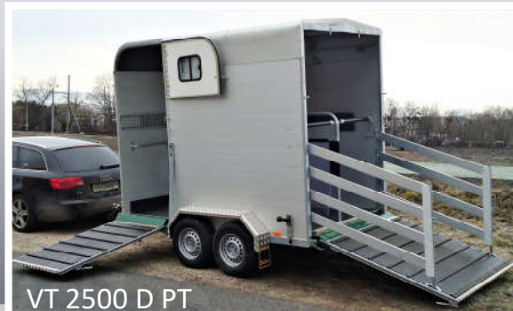
VT 2500 D PT