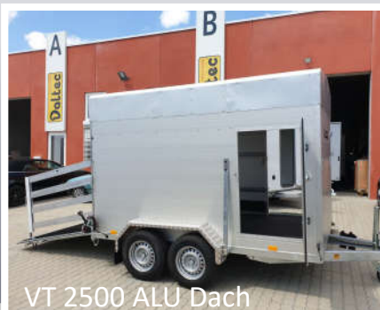
VT 2500 ALU Dach