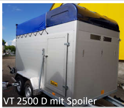
VT 2500 D mit Spoiler